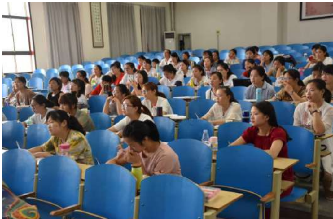
3、每天上课都能保持全勤